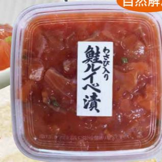
佐藤水産[北海道産] 24 わさび入り鮭レイベ漬 160g