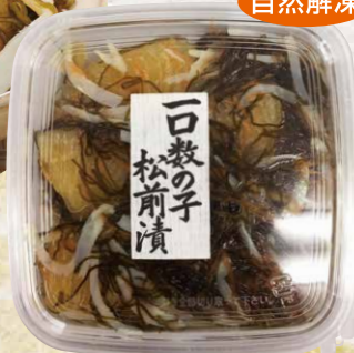
佐藤水産[数の子:太平洋産] 25 一口数の子松前漬 170g