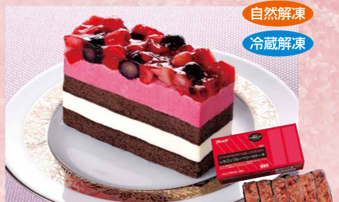
味の素冷凍食品 124 いちごとブルーベリーのケーキ 6個入(約77g×6)