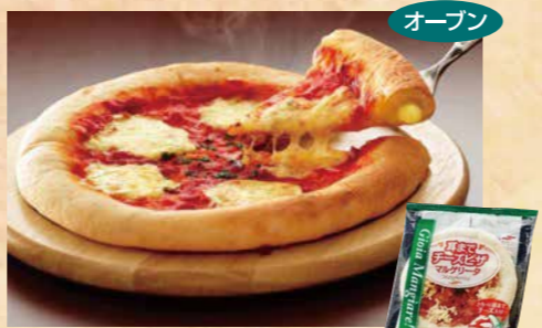
マルハニチロ 105 耳までチーズピザ マルゲリータR 245g