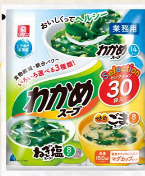
38 わかめスープセレクション30袋入 30食

わかめスープ: 4.2g×14食 スパイシーねぎ塩スープ: 4g×8食 焼煎ごまスープ: 6.7g×8食/袋