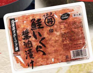
モリタン[北海道産] 19 鮭いくら醤油漬 250g