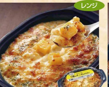
ヤヨイサンフーズ 114 FDG 7種のチーズのグラタン23 200g