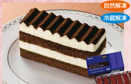
味の素冷凍食品 125 ポーションティラミス 6個入(約60g×6)