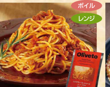
ヤヨイサンフーズ 111 Olivetoスパゲティ・ミートソースR 300g