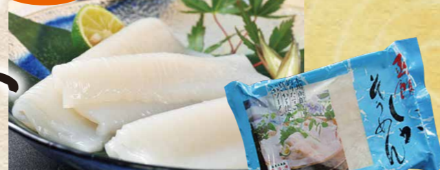
スハラ食品 7 函館いかそうめん 177g (いか100g+たれ35g×2、おろし生姜ミ=3.5g×2)