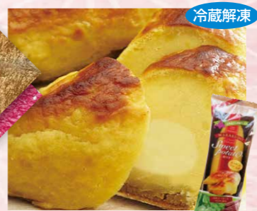
わらく堂 117 皮付きスイートポテト 1個(約160g)