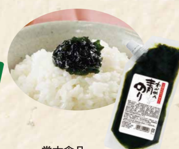
55 堂本食品青のり若芽入り 250g