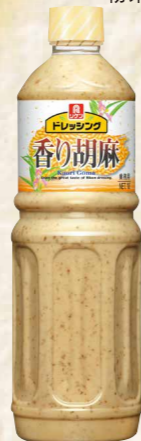
35 ドレッシング香り胡麻 1ℓ