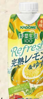
51 カゴメ野菜生活100Refresh 完熟レモン&ゆず 330g×12本