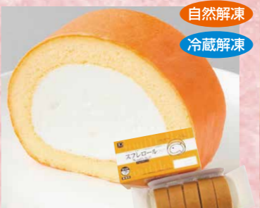
日東ベスト 127 JGSフレロール5(プレーン) 375g(5切)