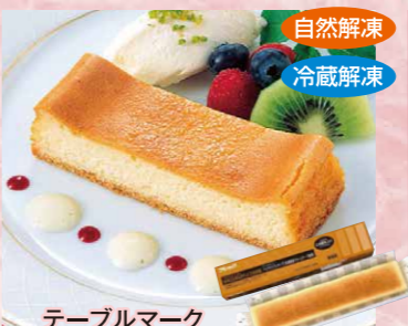
テーブルマーク 131 フリーカットケーキバイクチーズケーキ (北海道産生クリーム使用) V03 610g