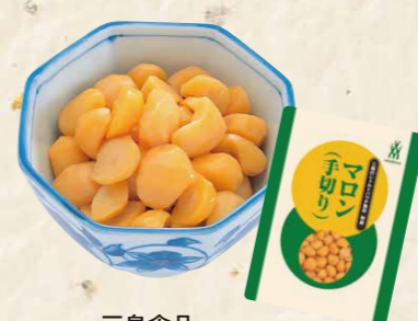
54 三島食品マロン(手切り)200g 200g