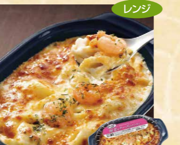
ヤヨイサンフーズ 112 FDG 海老とチーズのグラタン23 200g