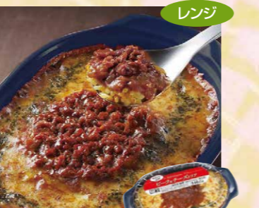
ヤヨイサンフーズ 116 FDG ビーフ&チーズドリア23 200g