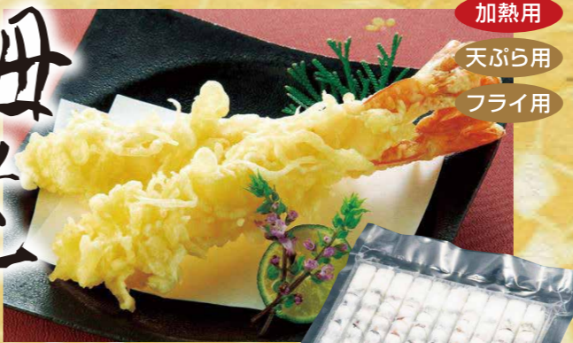
極洋[ベトナム産] 13 伸ばし海老一本勝負 BT 8/12 10尾