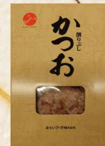
43 花かつお化粧箱 150g