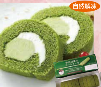
日東ベスト 129 宇治抹茶のロールケーキ10カット 105g(10切)