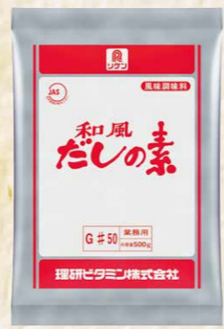
31 和風だしの素 #50 500g 粉末だし