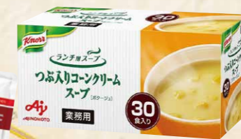
59 味の素クノールランチ用スープ つぶコンクリームスープ 30食