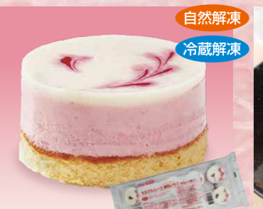
テーブルマーク 132 セルクルムース 練乳いちご Z09 320g(10個)