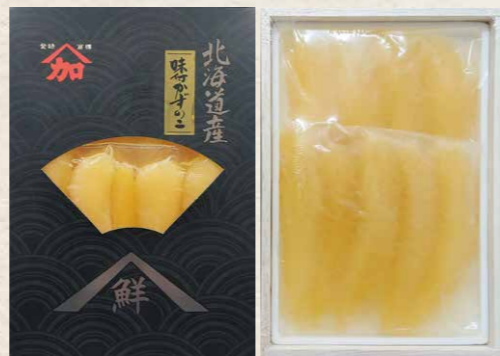
加藤水産 3 味の数の子 特大 300g(150g×2) 化粧箱入