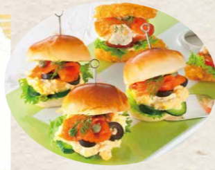
三洋食品[チリ・ノルウェー・トルコ産] 17 サーモンレットスライスJ・S 500g