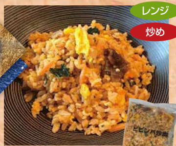
マルハニチロ 100 ビビンバ炒飯 230g