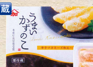
加藤水産 5 うまい数の子 (M) 200g/化粧箱入