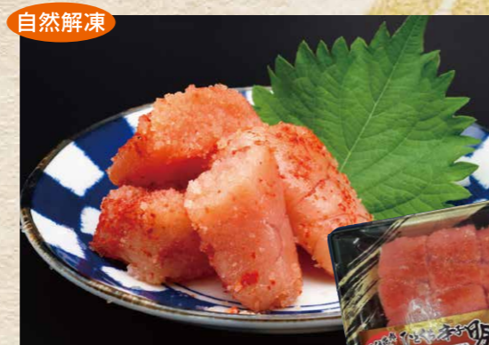
極洋[ロシア・アメリカ産] 21 羅臼昆布 辛子明太子一口パック 80g