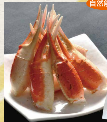
友田セーリング[カナダ産/中国加工] 11 ボイルズワイ殻付爪リングカット(カナダ) 31/40 1kg(NET810g)