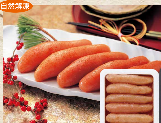
かねふく[アメリカ・ロシア産] 20 無着色からし明太子 400g(6-9本)