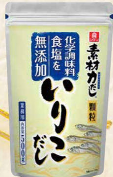
39 素材力だしいりこだし 500g

わかめスープ: 4.2g×14食 スパイシーねぎ塩スープ: 4g×8食 焼煎ごまスープ: 6.7g×8食/袋