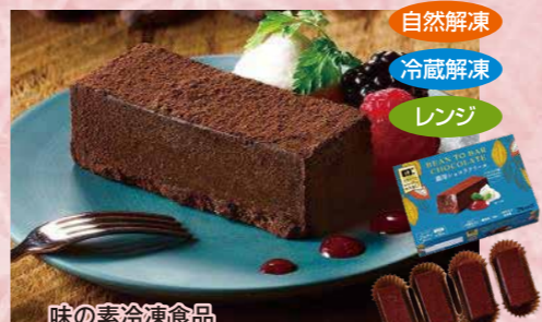
味の素冷凍食品 123 レンジでロスなし濃厚ショコラテリーヌ (Bean to Bar Chocolate使用) 4個入(約52g×4)