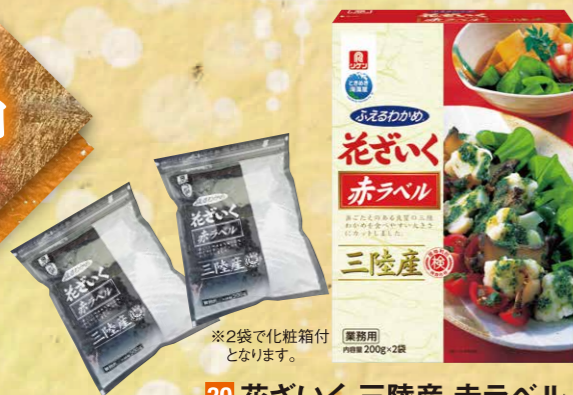
30 花ざいく 三陸産 赤ラベル 200g