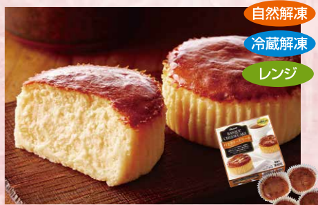
味の素冷凍食品 122 レンジでロスなしバスクチーズケーキ 4個入(約65g×4)