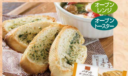
デルソーレ 106 バゲット ガーリックバター 約175g