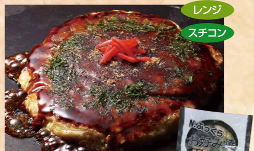
四国日清食品 107 ふっくらお好み焼(豚玉) 200g お好み焼き180g+ソース20g・削り粉・あおさ