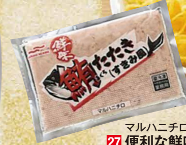
マルハニチロ[まぐろ:国産・国内加工] 27 便利な鮮味まぐろたたき(すきみ風) 80 80g