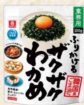
40 ふりかける ザクザクわかめ韓国風ごま油風味 100g