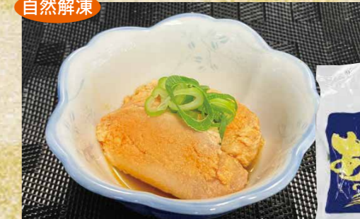
マルハニチロ[中国産] 29 冷凍あん肝 200g