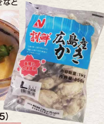
ニチレイフレッシュ[広島県産] 22 割鮮広島産かき L(31/35) 1kg(NET850g)