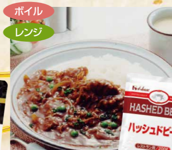
58 ハウスギャバンハッシュドビーフ 200g