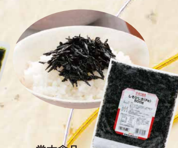
56 堂本食品しそひじきFe 500g