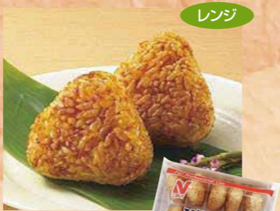
ニチレイフーズ 102 N焼おにぎり 500g(10個)