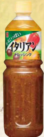
34 野菜いっぱいドレッシングイタリアン 1ℓ