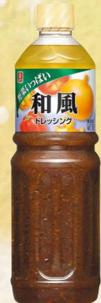
33 野菜いっぱいドレッシング和風 1ℓ