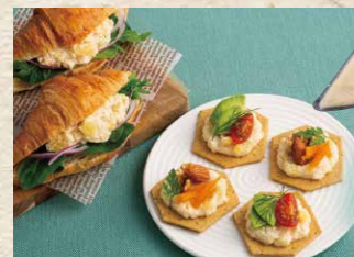
極洋 6 数の子&チーズR 300g