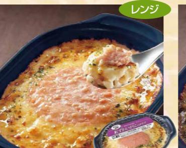
ヤヨイサンフーズ 115 FDG 紅ずわいがいのドリア23 200g