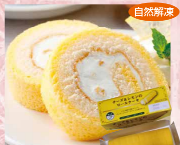
日東ベスト 130 チーズ&レモンのロールケーキ10カット 105g(10切)