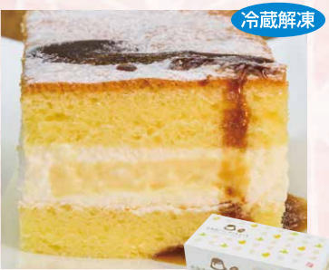
わらく堂 119 北海道プリンサンドケーキ 1個(約170g)