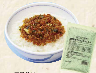
53 三島食品-18℃以下保存 鶏そぼろと焦がしネギ 130g