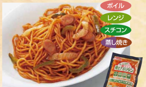
マルハニチロ 108 もっちり麺の焼きナポリタン 250g