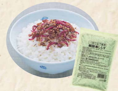
52 三島食品-18℃以下保存 梅しらす 100g