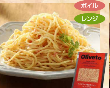
ヤヨイサンフーズ 110 Olivetoスパゲティ・明太子ソースR 280g