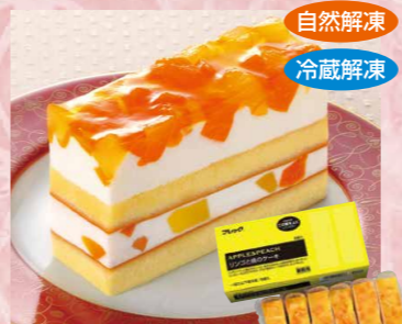
味の素冷凍食品 126 リンゴと桃のケーキ 6個入(約80g×6)