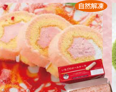
日東ベスト 128 いちごのロールケーキ10カット 105g(10切)