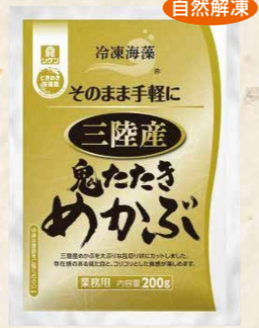
41 冷凍海藻そのまま手軽に鬼たたきめかぶ三陸産 200g