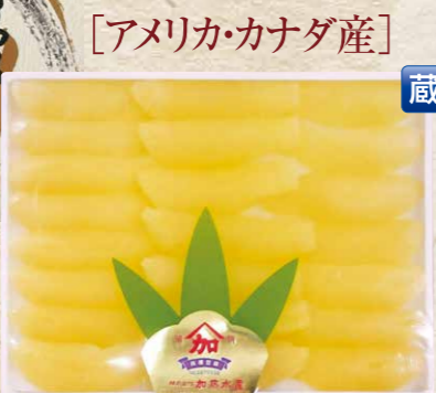
加藤水産 2 味の数の子 大折 500g/化粧箱入