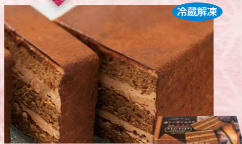
わらく堂 120 さぼろ赤レンガショコラ 1個(約180g)