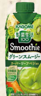
49 カゴメ野菜生活100Smoothie グリーンスムージー 330g×12本