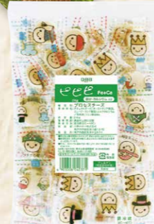
45 六甲バターピピピチーズ鉄分・カルシウム入り 210g(40粒以上)