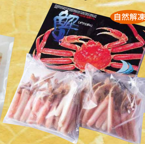
友田セーリング[カナダ産] 12 生ズワイ棒ポーション(生食用)カナダ4L/3L 約500g(20~25本)