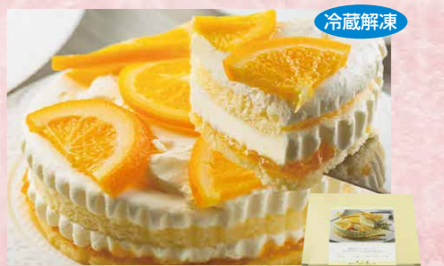
わらく堂 121 オレンジ&バターケーキ 1個(約230g)