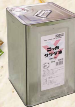
42 J-NIKKAパートナーズホワイトサラダ油 8kg缶