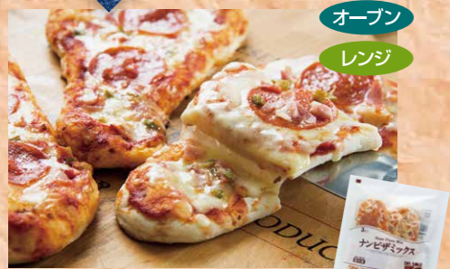
デルソーレ 103 ナンピザミックス 約107g×3枚