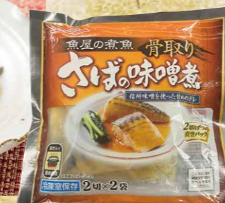
極洋[サバ:ノルウェー産] 28 魚屋の煮魚 骨取りさばの味噌煮 180g(90g×2)