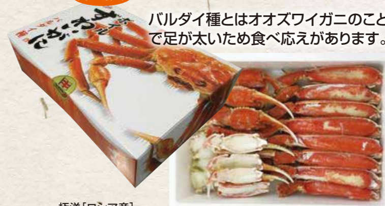
極洋[ロシア産] 9 ボイルバルダイ(オオズワイガニ)ハーフポーション(化粧箱) 1Kg