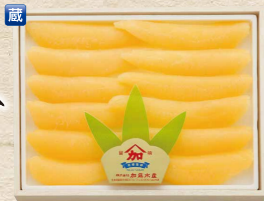
加藤水産 1 数の子 特々大 500g/桐箱入