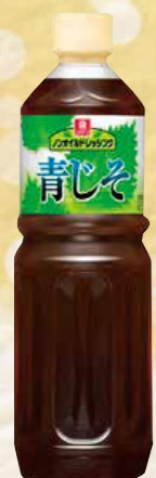
32 ノンオイルドレッシング青じそ 1ℓ