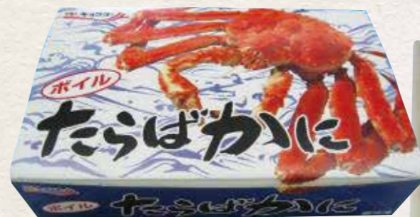
極洋[ロシア産] 8 ボイルたらばかにハーフポーション(化粧箱) 800g