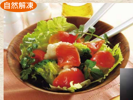
極洋[トルコ産] 16 トラウトスモークカット 500g