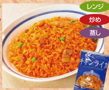
ニチレイフーズ 101 RUチキンライス250 250g