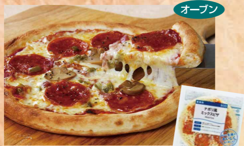
デルソーレ 104 ナポリ風ミックスピザ 800 約200g