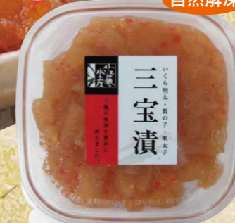
佐藤水産 26 三宝漬 120g 数の子・辛子明太子・いくら入