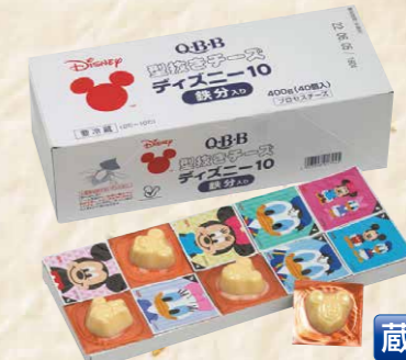
47 六甲バター型抜きチーズディズニー10鉄分入り 10g×40個