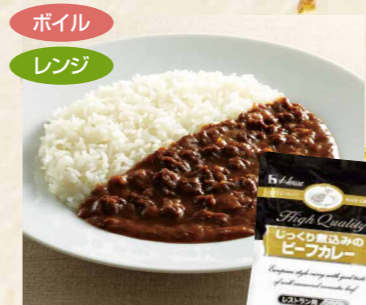
57 ハウスギャバンじっくり煮込みのビーフカレー 200g