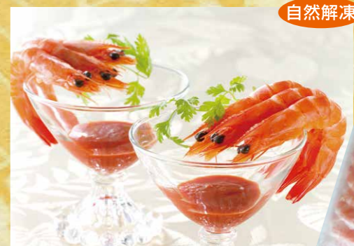
極洋 14 ライブボイル中ムキバナメイえび2L 20尾