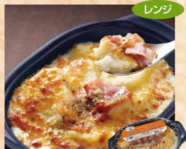
ヤヨイサンフーズ 113 FDG ポテト&ベーコングラタン23 200g