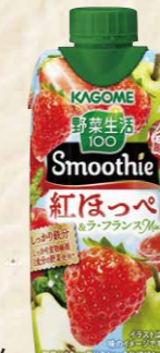
50 カゴメ野菜生活100Smoothie 紅ほっぺ&ラ・フランスMix 330g×12本