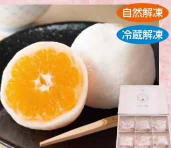
小林果園[温州みかん:愛媛県産] 133 しずく珠(みかん大福) 6個