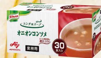
60 味の素クノールランチ用スープ オニオンコンソメ 30食