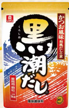
37 和風だしの素黒潮だし 1kg 顆粒だし