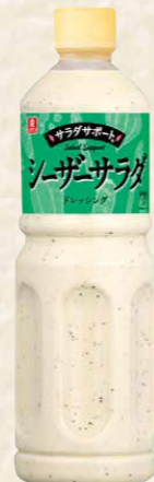
36 サラダサポートシーザーサラダドレッシング 1ℓ