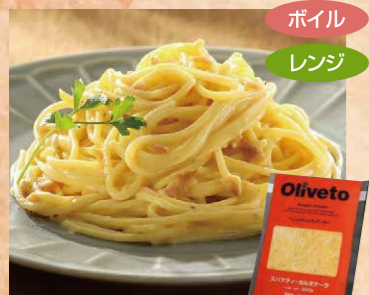
ヤヨイサンフーズ 109 Olivetoスパゲティ・カルボナーラR 300g