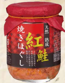
48 極洋[アラスカ産天然紅鮭] 熟成紅鮭焼きほぐし 100g