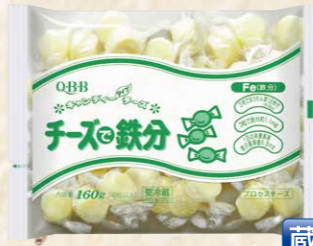
46 六甲バターキャンディーチーズチーズで鉄分 160g(30粒以上)