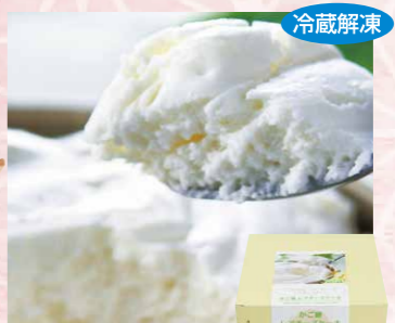
わらく堂 118 かご盛レアチーズケーキ 1個(約200g)